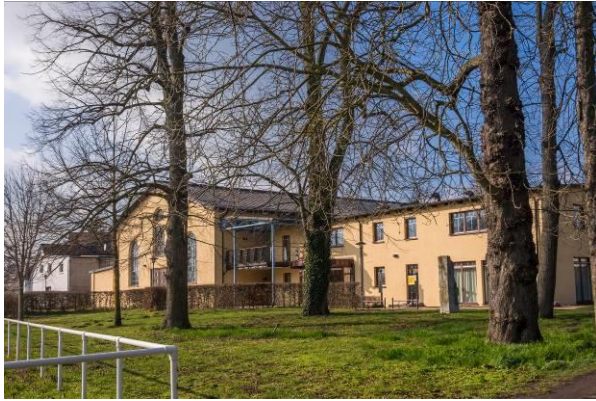
Der Tagungsort Bürgerhaus am Sonnenplatz in Güstrow.

Es wird eine Seminarpauschale in Höhe von 20,- EUR erhoben. Diese schließt eine Getränke- und Mittagsvorsorgung ein. Bitte entrichten Sie diesen Betrag zum Beginn der Veranstaltung.