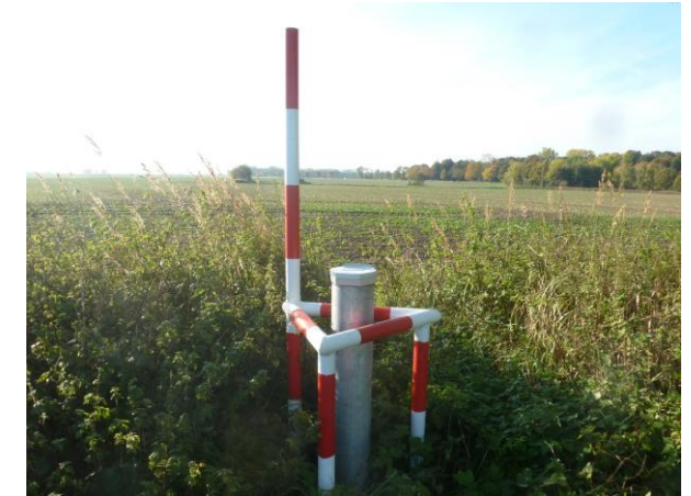
Grundwasserlandesmessstelle Barth